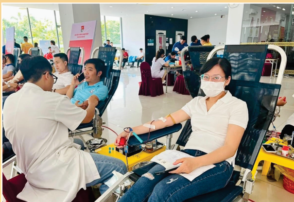
Đoàn viên Chi đoàn Sở Tư pháp tham gia Chương trình Hiến máu tình nguyện - Tuổi trẻ chung tay vì sự sống cộng đồng do Đoàn khối Cơ quan và Doanh nghiệp tổ chức, phát động