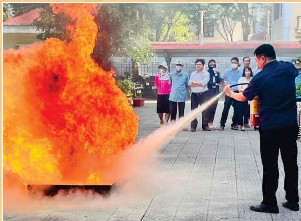
Tập huấn, bồi dưỡng nghiệp vụ PCCC&CNCH, thực tập phương án chữa cháy và cứu nạn, cứu hộ cho Lãnh đạo, công chức, viên chức và người lao động Sở Tư pháp